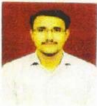
Jnana Sahyadri - Shankaraghatta ಕ್ರಮ ಸಂಖ್ಯೆ / Sl. No. : KU199007 Date of Issue : 24 - 03 - 2016 KUS

ವಿಶ್ವವಿದ್ಯಾಲಯದ ಮೊಹರಿನೊಂದಿಗೆ ನೀಡಲಾಗಿದೆ. Given under the seal of the University.